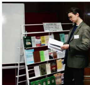
Международная научно-практическая конференция «Канадский опыт мультикультурализма, поддержания мира и российская политика на Кавказе» (г. Волгоград, 14–15 апреля 2011 г.)